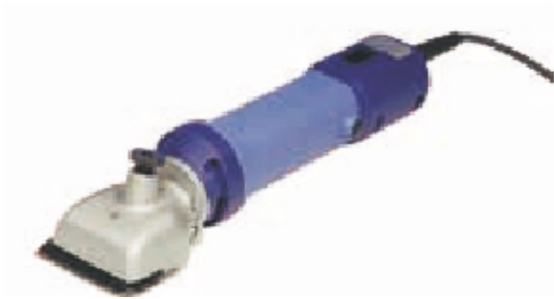
971065-80 komplett elektromos nyíró CC320, 320 W 971064-95 juh nyírófej 3"